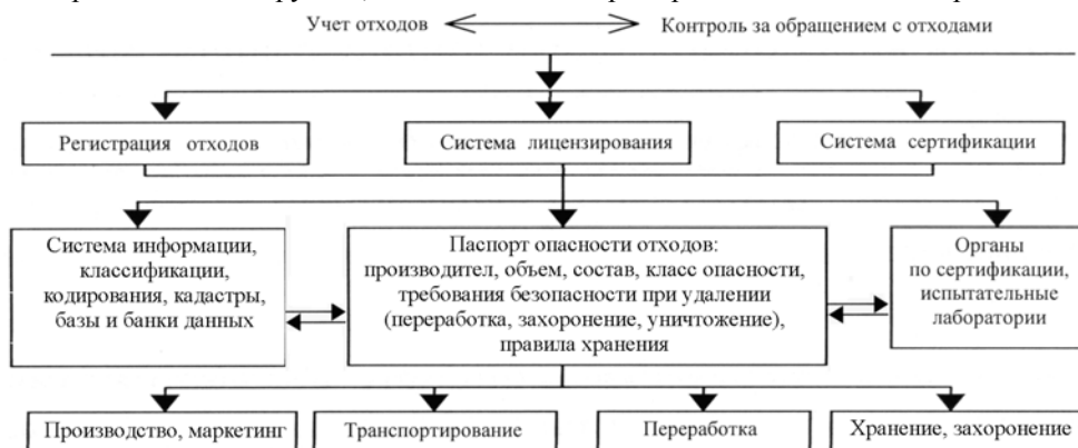
Рис. 3. Схема регионального регулирования обращения с отходами на основе их паспортизации и сертификации

Для ознакомления с воздействием типичных объектов размещения отходов был выбран полигон ТБО г. Мурманска, находящийся в пос. Дровяное. О воздействии полигона на поверхностные воды можно заключить по результатам многолетних наблюдений Мурманского УГМС за загрязнением снежного покрова и воды в ручьях, в бассейнах которых размещен полигон городских ТБО. Анализ