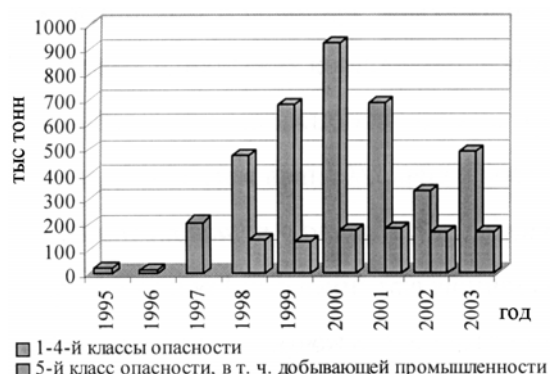
Рис. 1. Динамика образования отходов различных классов опасности