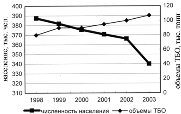
Рис. 4. Динамика изменения численности населения г. Мурманска и объемов утилизации ТБО на ОАО "Завод ТО ТБО"

Анализ проблем обращения с ТБО в Мурманской области и отечественного и зарубежного опыта позволил определить следующие рациональные направления удаления и переработки ТБО: предотвращение поступления